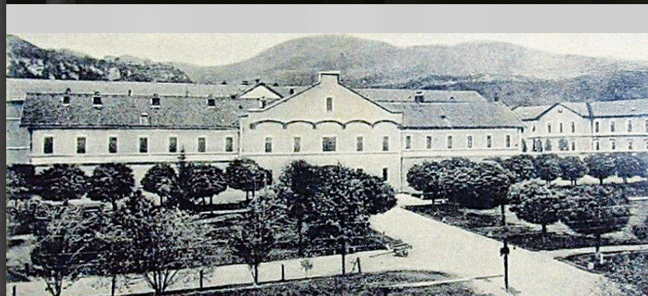
Зеница, Главна казнионица за БиХ.