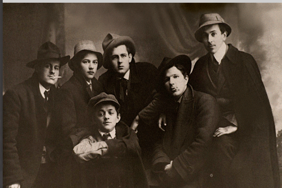
Група припадника Тајне југословенске револуционарне гимназијске организације у Тузли по изласку из зеничке казнионице.

Бачке организације почеле су се оснивати по средњим школама широм земље, интензивније након анексије 1908. с циљем упознавања са словенском литературом, да би већ 1911-1912. доживјеле извјесне промјене. До тада чисто литерарне, омладинске организације по средњим школама добивају револуционарни карактер и због околности дјеловања постају тајне. Бачко друштво у Тузли све од првог помена 1904. године па до априла 1914. било је састављено искључиво од Срба и неколико Срба муслимана. Након тога, свега два мјесеца прије атентата, у друштво улазе и Хрвати, њих четворица. Самим тим, у ранијој литератури познат термин. Српско-хрватска револуционарна омладина, када је ово друштво у питању, није у потпуности прихватљив, јер није истински утемељен. Хрвата и муслимана било је у тек незнатном броју. Разлози њиховог приласка Србима, такође су различити, од посве практичних, ради бољег разумијевања словенске литературе пред матуру, па до оних прикривених и срачунатих - идеолошких.