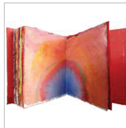
МАРИЈА ВУКОТИЋ „Кругови“