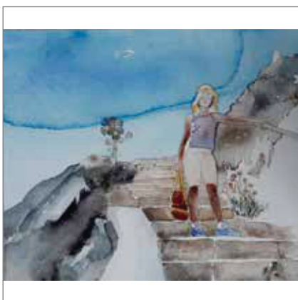
МИЛОМИРКА ПЕТРОВИЋ „Степеницама...“