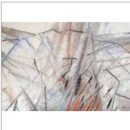
РАНЂЕЛОВИЋ ВЛАДАН „Продор“