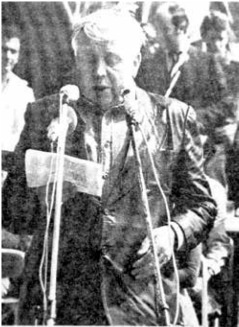
Branko ĆOPIĆ čita svoje stihove na Kozari