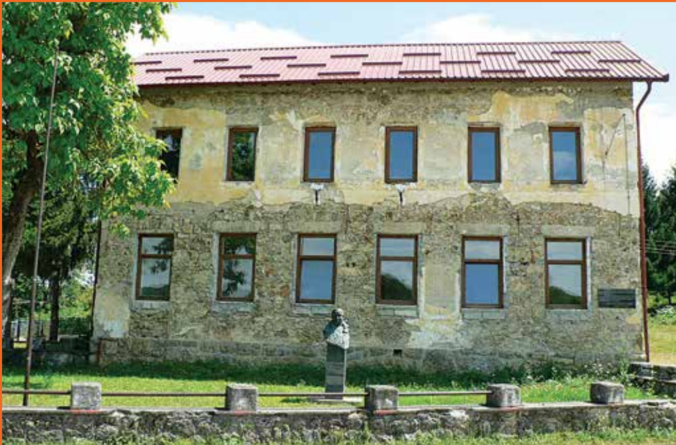
„Трејери суза... Ту је школа била, а сад – гроб ситишан у њрољеће рано. Под мрким зидом њујује дјејињсиво, дјејињсиво моје – бомбардовано...”