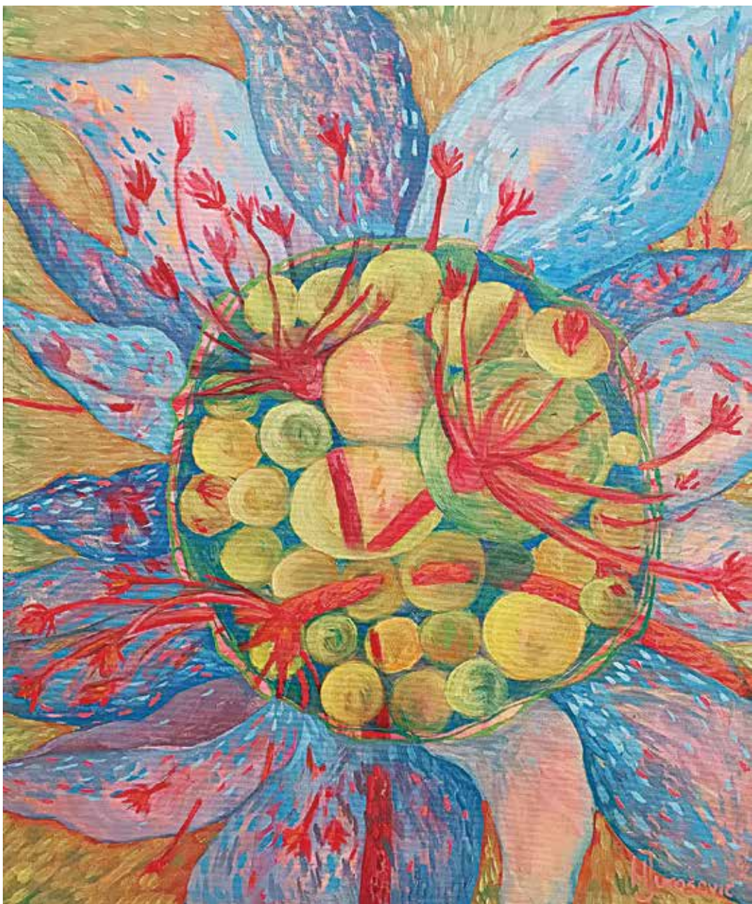
Цвијетови, уље на илајну, 60x50 цм