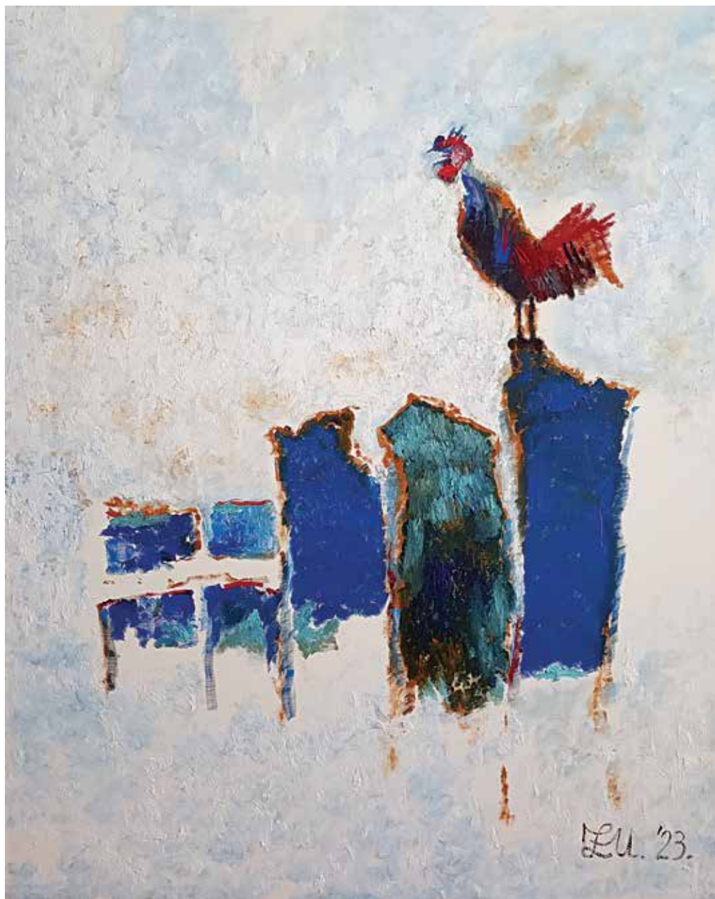
Пеџао I, уље на ѿлајћну, 100x80 цм