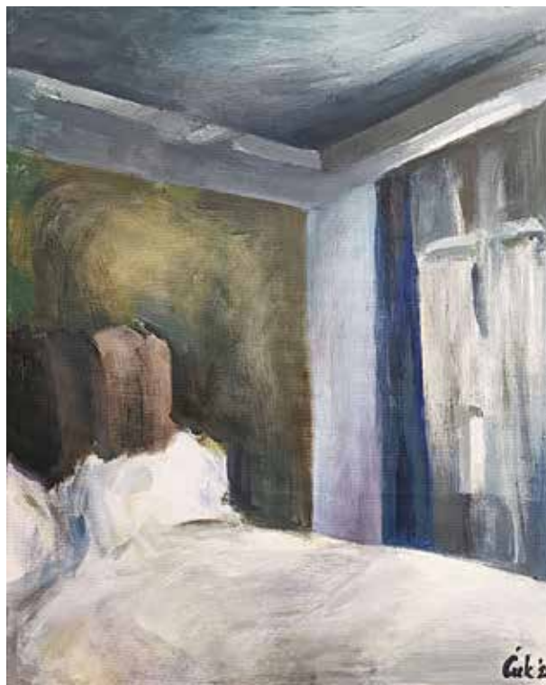
Соба, акрилик на њлајну, 60x40 цм