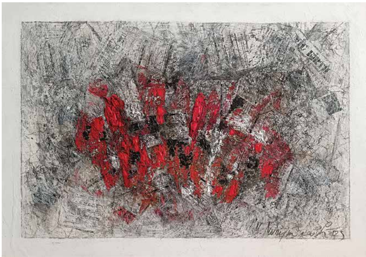
Козара II, комбинована техника, 70x100 cm