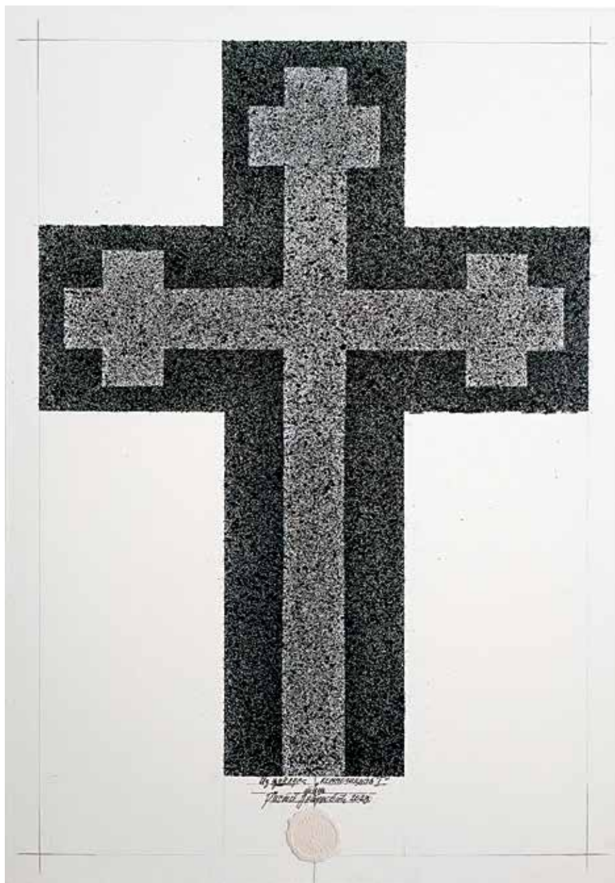
Из циклуса, Композиција II , туш на илајну, 100x70 цм