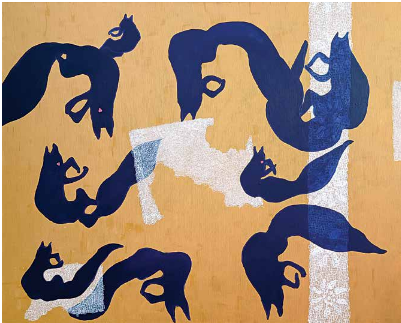
Козарачко коло, комбинована техника, 80x100 цм