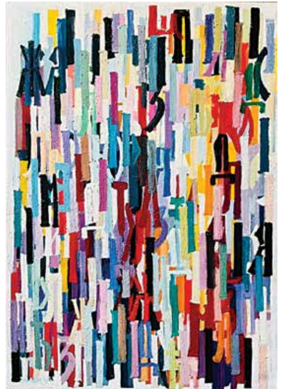
Жеља, уље на илајну, 92x65 цм