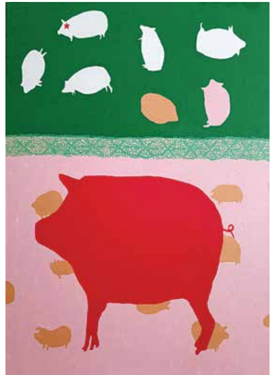
Свиње Козаре, комбинована техника, 100x80 цм