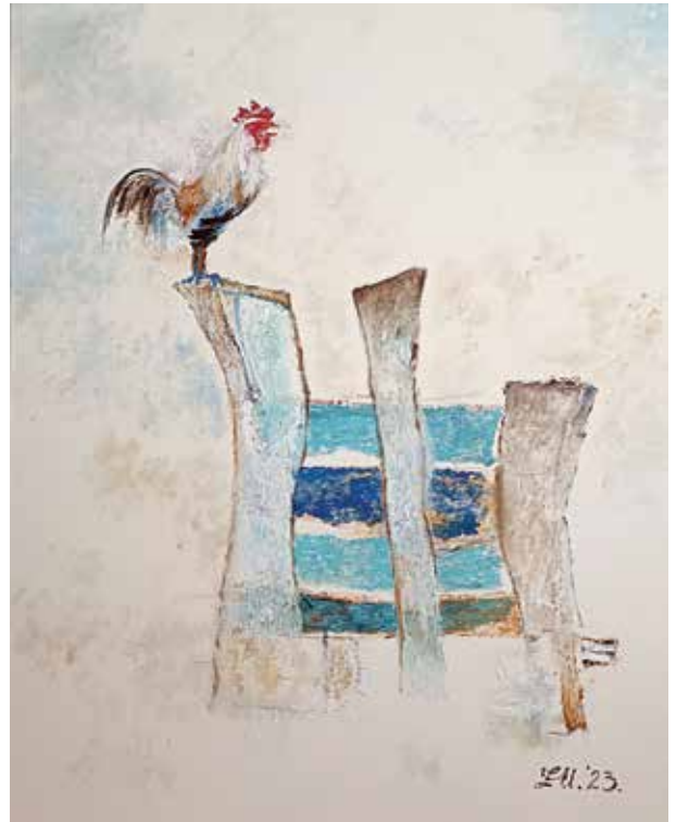
Пејао II, уље на њлајну, 100x80 цм