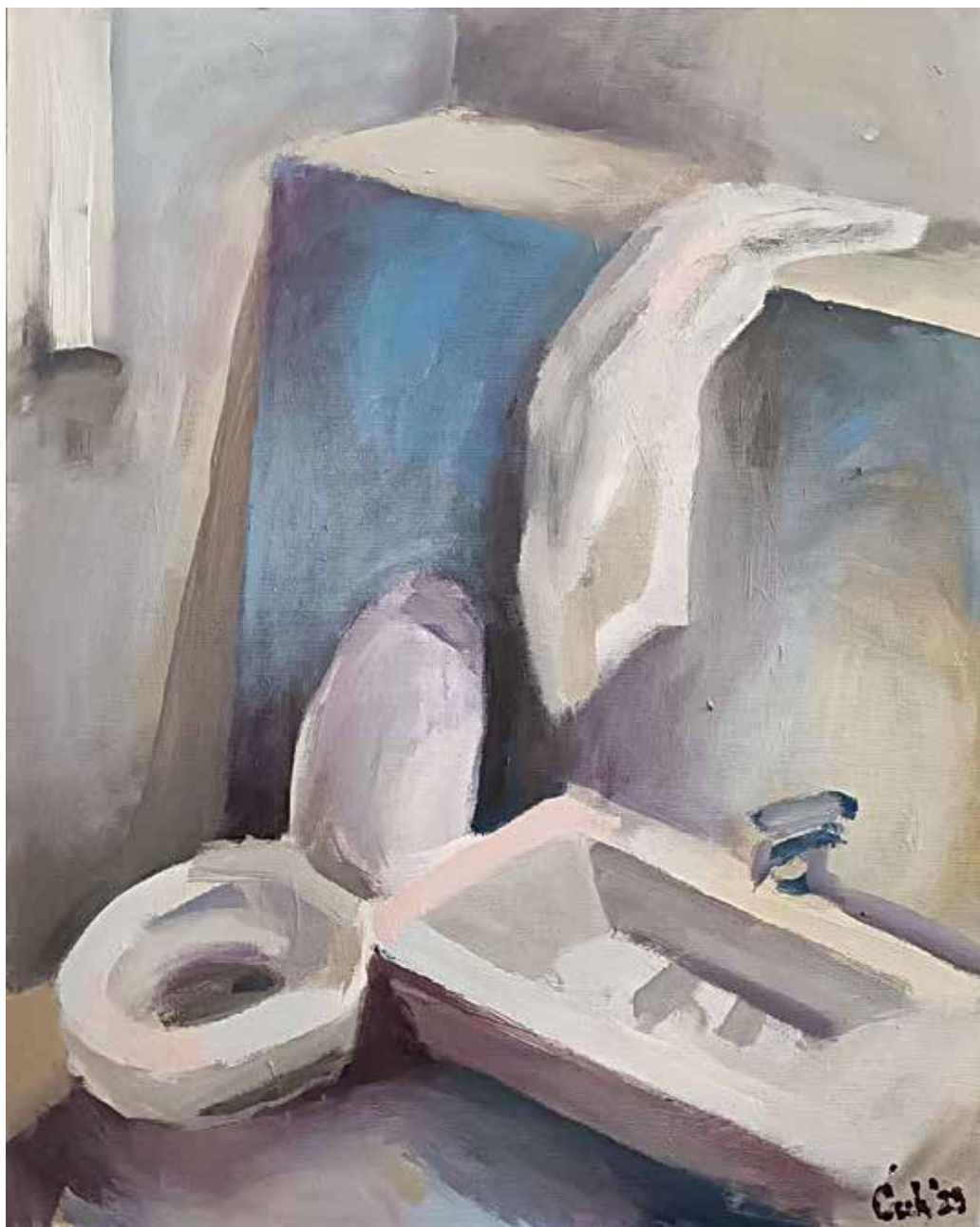
Куйайило, акрилик на йлайну, 60x40 см