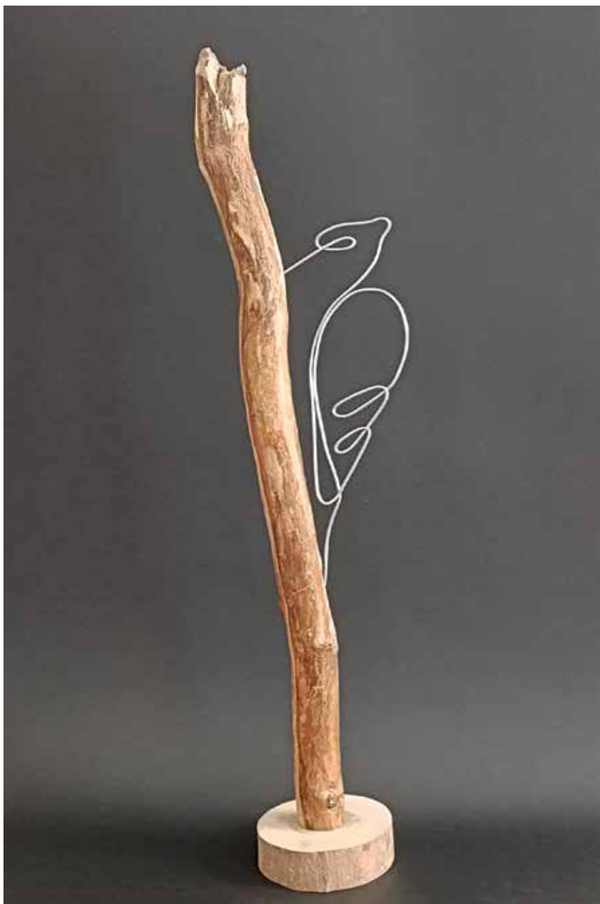
Из циклуса, Божија створења, рад I, 42x13 цм, жица и дрво