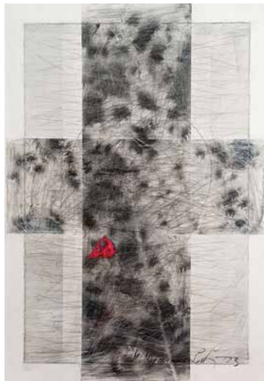
Искра наде, комбинована техника, 100x70 цм