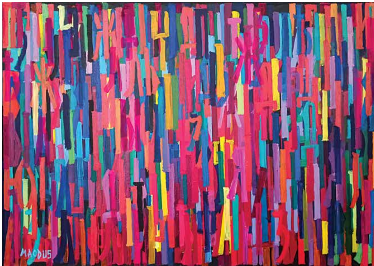
Сан, акрилик на йлайну, 65x92 см