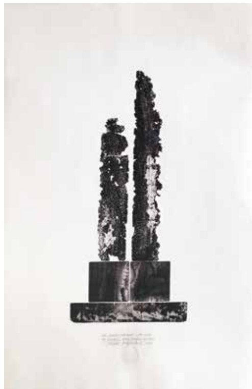
Омаж рајнику свейлостии, Е.А. бакройис акваининиа-сува иїла, 100x70 цм, 2022.