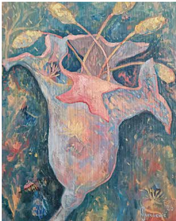
Цвијей, уље на њлајну, 50x40 цм