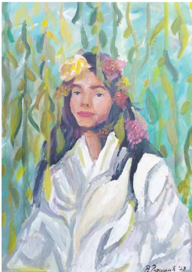
АЛЕКСАНДРА РАДИШИЋ БЕЗ НАЗИВА, акрил на илајну, 100x70 цм