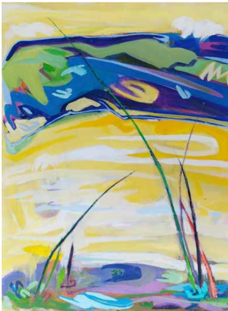
САЊА СТУПАР БЕЗ НАЗИВА, акрил на илајну, 80x60 цм