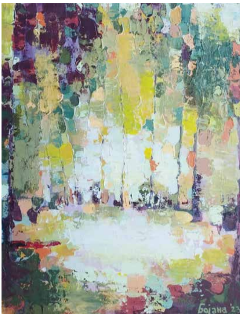
БОЈАНА ПАЧАВРА БЕЗ НАЗИВА, акрил на џлајну, 50x40 цм