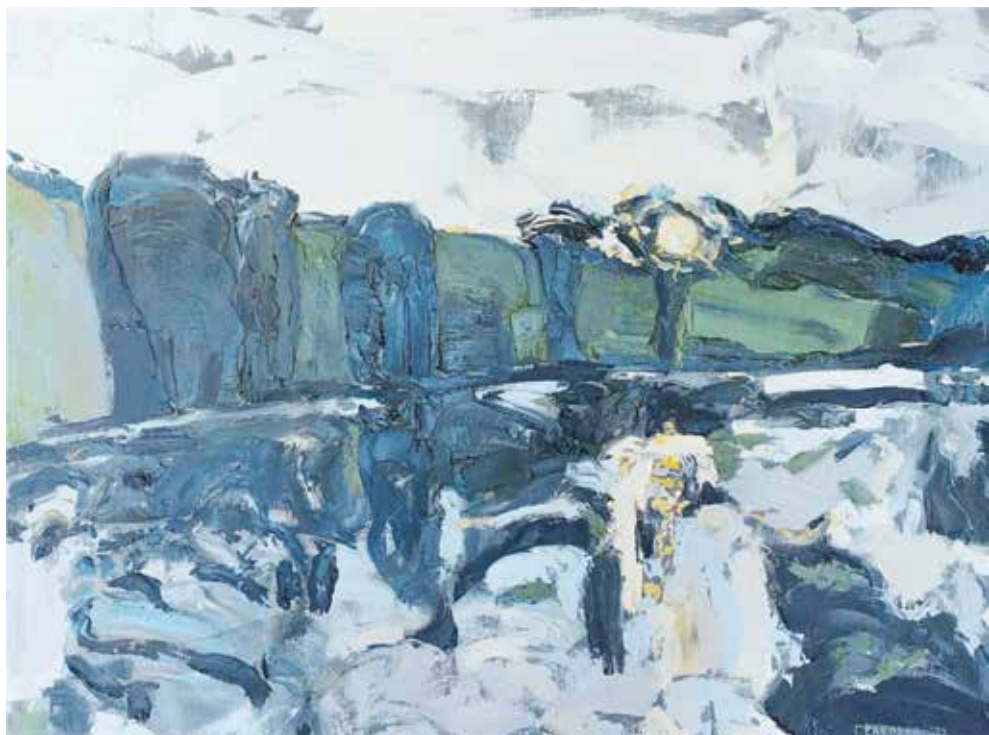
ДАВОР ГРАБОВАЦ УНА XIV, уље на илајну, 60x80 цм