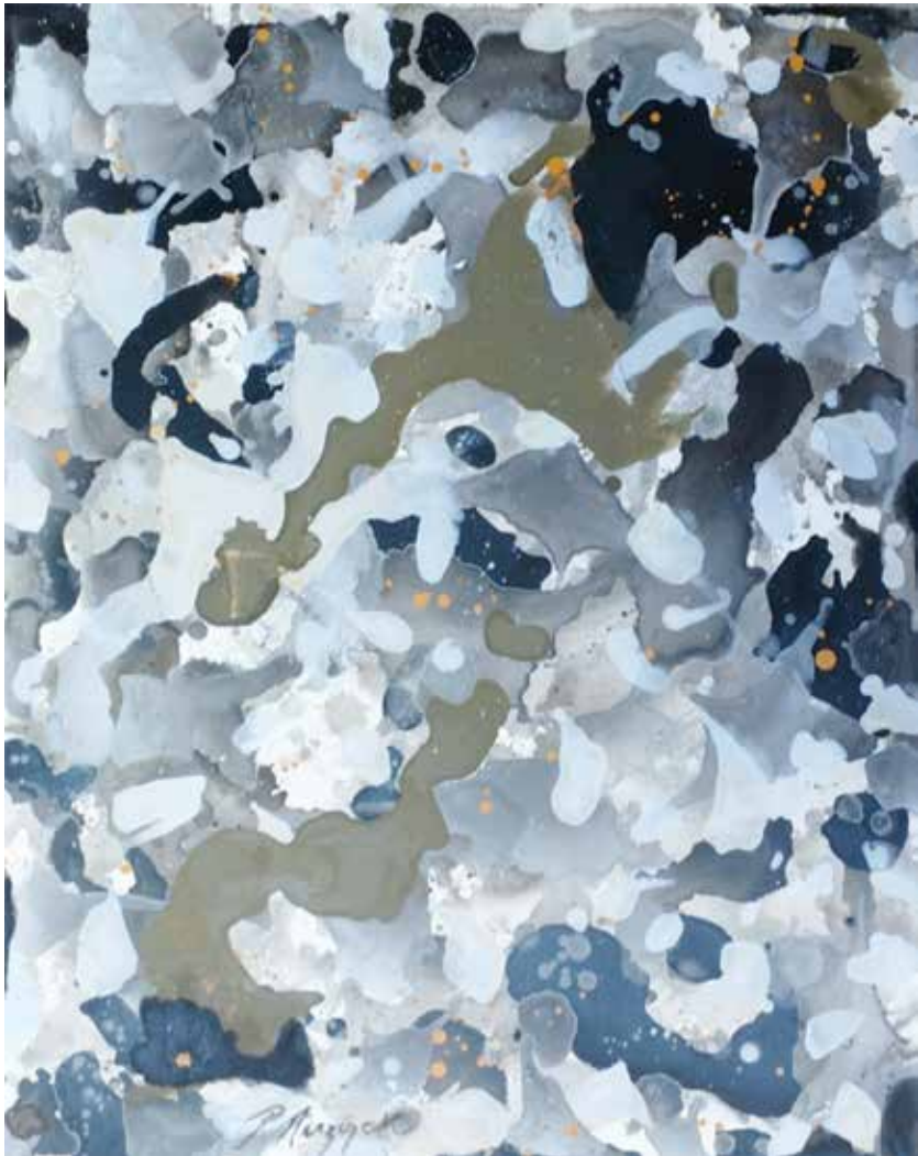
РАДМИЛА ЛИЗДЕК БЕЗ НАЗИВА, акрил на џлајну, 100x80 цм